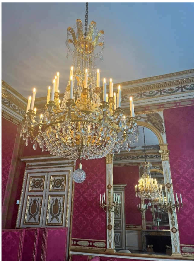
Lustre de la Chambre de l'Empereur (inv. C.425c)