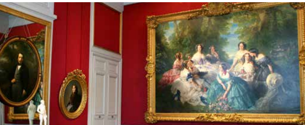
Musée du Second Empire @ Château de Compiègne / C.Schryve

À travers anecdotes et objets personnels plongez dans le quotidien d'un personnage fascinant, et laissez-vous surprendre par une facette plus humaine et méconnue du célèbre souverain.