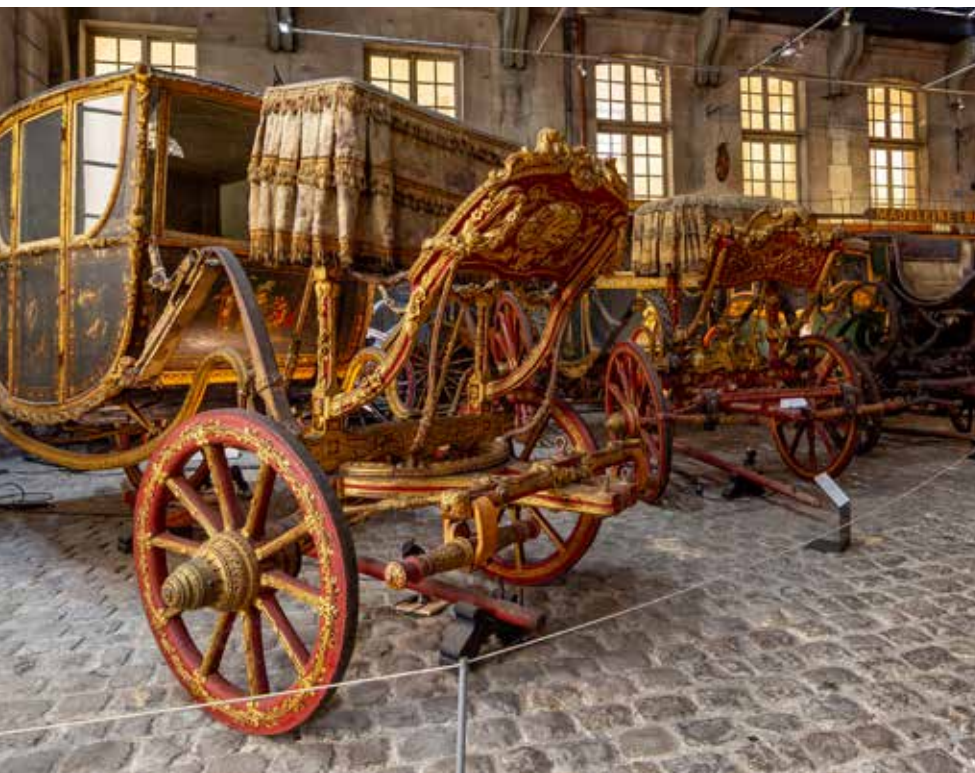
Musée national de la Voiture

D'étranges objets sont présentés dans l'exposition Bizarreries . Sauras-tu retrouver leur usage ?