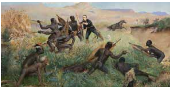
Paul Joseph Jamin (1853-1903), Mort du prince Impérial au Zoulouland, 1 er juin 1879

Les enfants prolongent la visite avec un atelier de modelage, en écho aux pratiques artistiques de son époque.