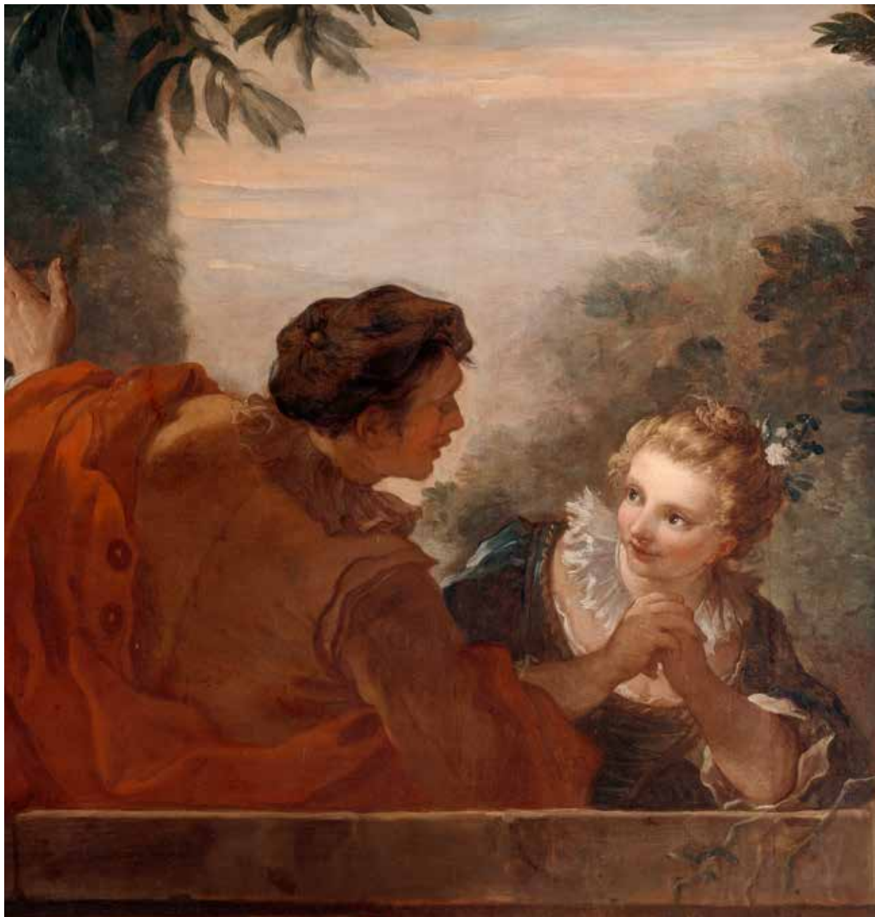
Charles-Joseph Natoire, Départ de Sancho pour l'île de Barataria