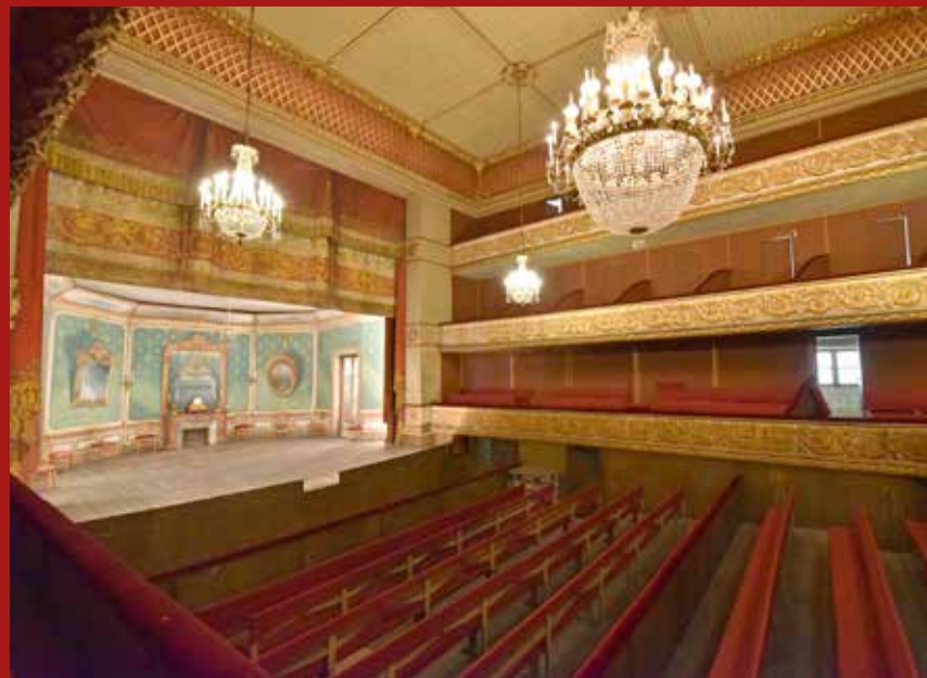
Théâtre Louis-Philippe

Un moment sensoriel et créatif à vivre en famille, pour allier Histoire et esprit des fêtes.