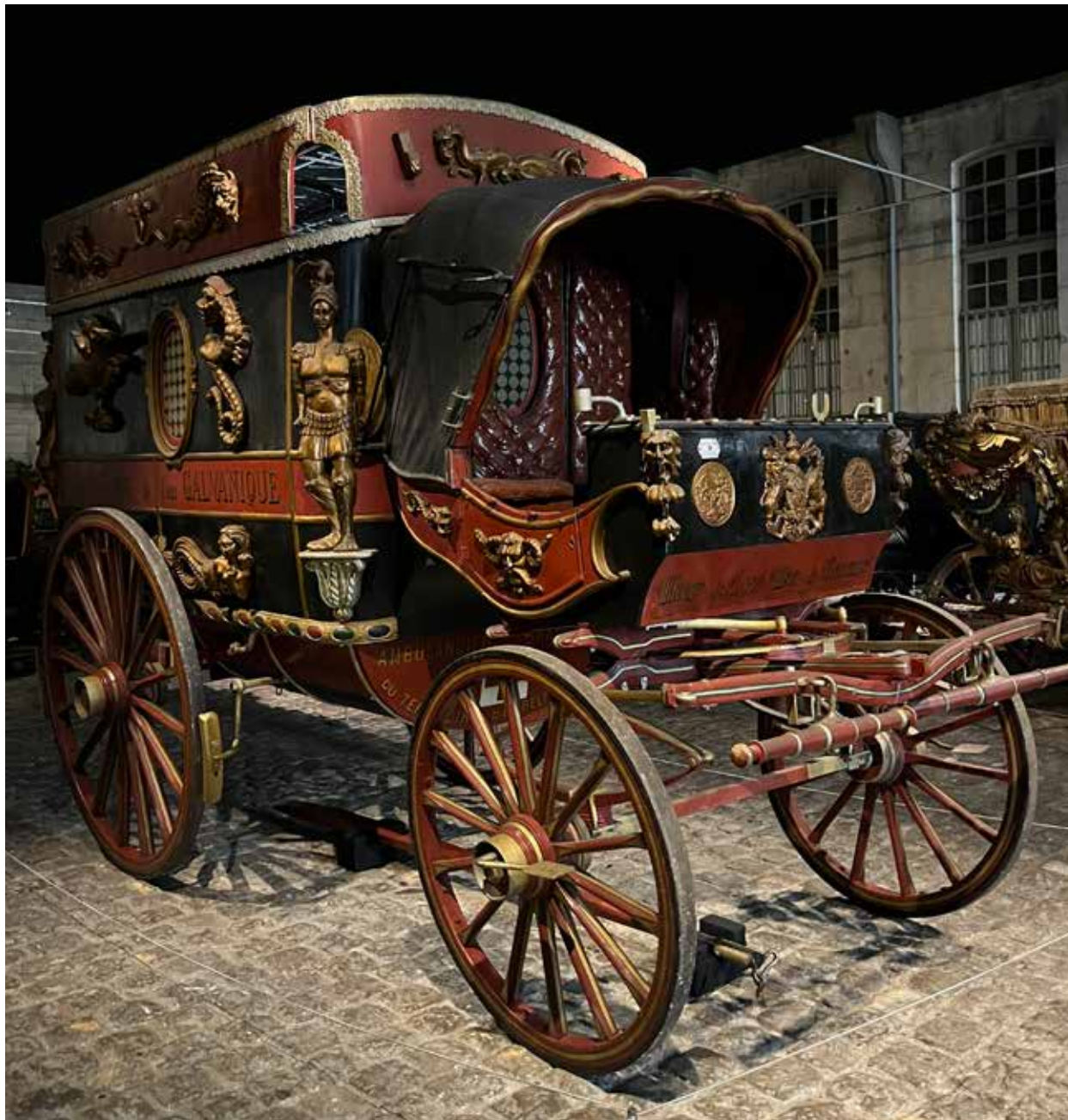
Voiture du dentiste ambulant Sorino