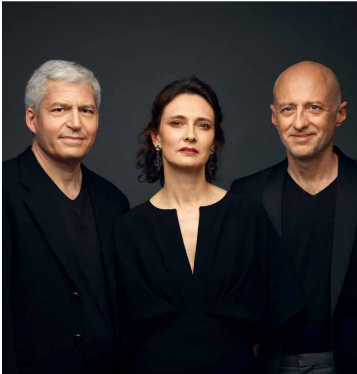
Les Folies françaises © Manuel Braun