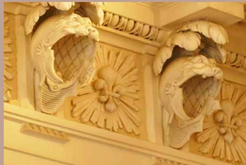
Salle des Gardes

Ce rendez-vous convivial et accessible à tous met à l'honneur la créativité, l'échange et le plaisir de partager en famille une expérience culturelle originale dans le cadre unique du château.