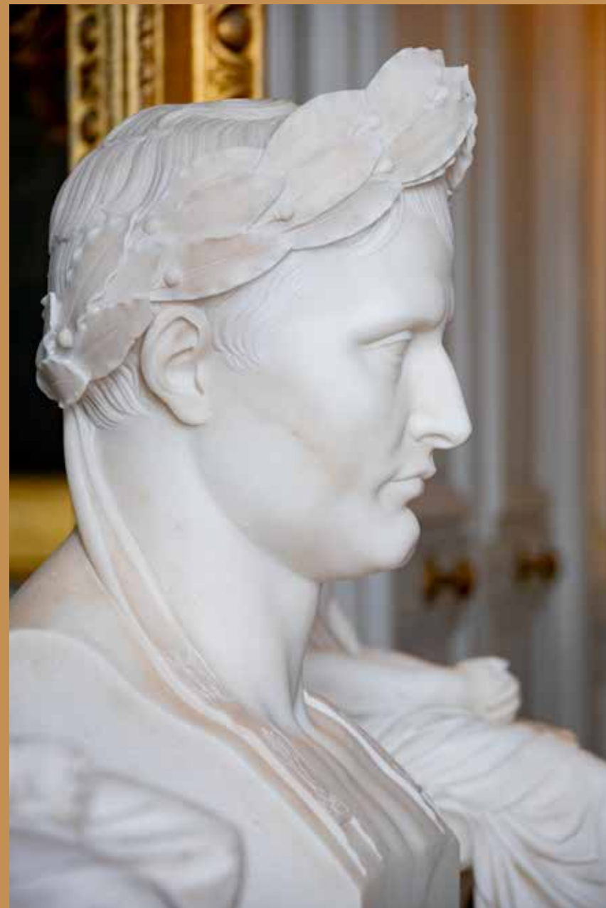
Napoléon I er , Salon des Cartes

À travers anecdotes et objets personnels plongez dans le quotidien d'un personnage fascinant, et laissez-vous surprendre par une facette plus humaine et méconnue du célèbre souverain.