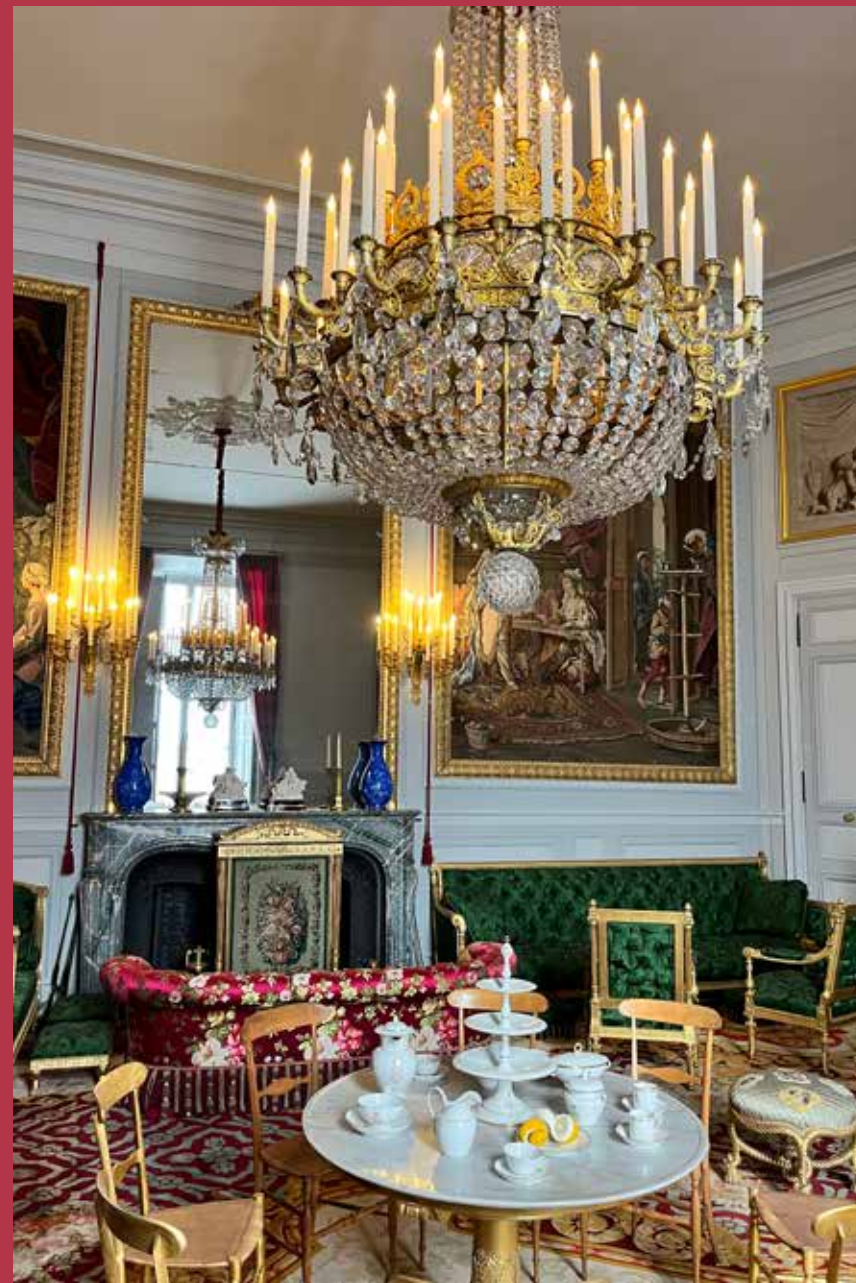
Salon de Thé de l'Impératrice

Prolongez la découverte par un atelier de création où petits et grands inventent leur propre enseigne ou girouette !