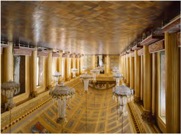
Galérie de Bal

PARCOURS THÉMATIQUE Sur l'application numérique du Château (voir au verso)