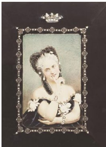
1 Émile Defonds, L'Impératrice Eugénie à Biarritz , 1858