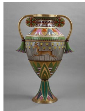
4 Jean-Charles Develly François-Hubert Barbin Vase Egyptien B