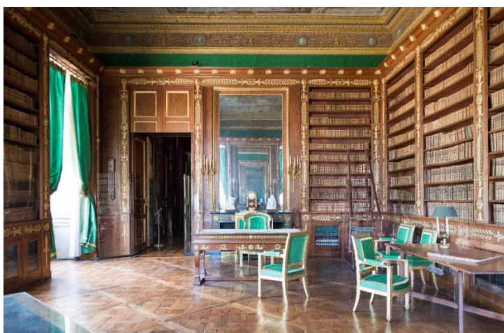
État des lieux avant restauration en 2017.

Cabinet de travail de l'Empereur, la bibliothèque comprend également un bureau en loupe d'orme pour son secrétaire, ainsi qu'une grande table pour l'étude des cartes.