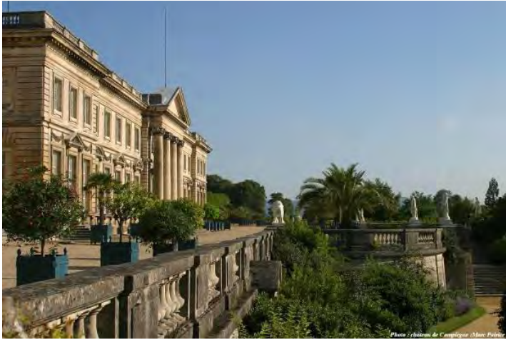
Palais de Compiègne, vue du parc

De Clovis à Napoléon III, presque tous les souverains ont séjourné à Compiègne, résidence située aux abords de l'une des plus belles forêts de France. Les quatre familles royales qui se succédèrent sur le trône : Mérovingiens, Carolingiens, Capétiens et Bourbons y édifièrent des demeures successives. Louis XIV n'y fit pas moins de soixante quinze séjours, qui trouvèrent leur apothéose dans le fameux camp de Coudun (1698), célèbre par le récit qu'en a laissé Saint-Simon : le faste de ces grandes manœuvres militaires devait éblouir l'Europe.