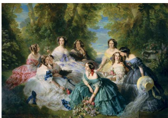
Franz Xaver Winterhalter L'Impératrice Eugénie entourée de ses dames d'honneur 1855