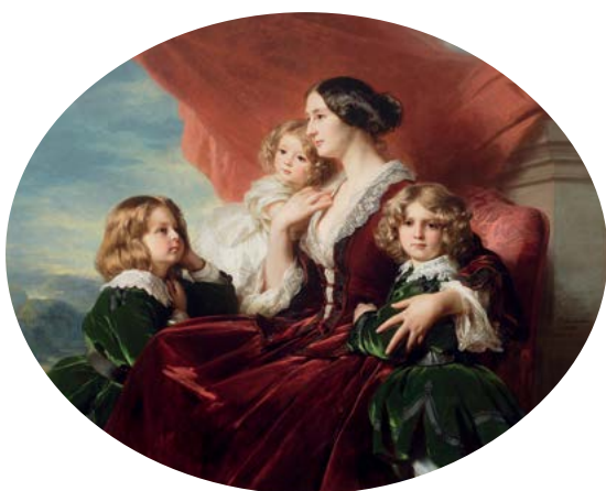
Franz Xaver Winterhalter La comtesse Krasińska et ses enfants 1853