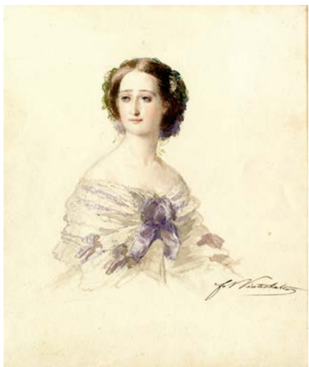
Franz Xaver Winterhalter L'Impératrice Eugénie 1855