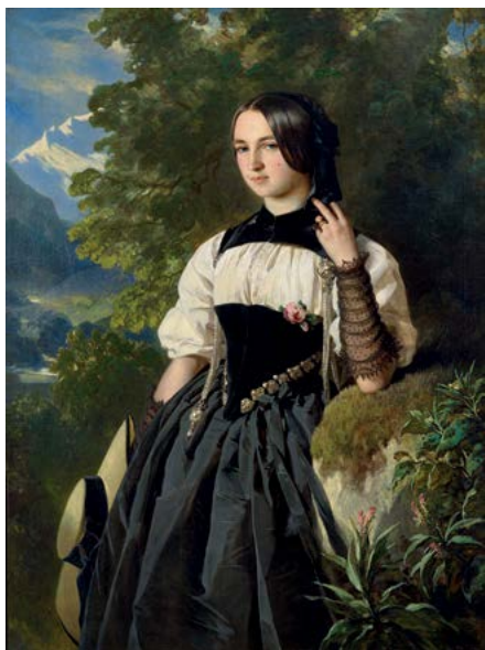
Franz Xaver Winterhalter Jeune Suisse d'Interlaken années 1840