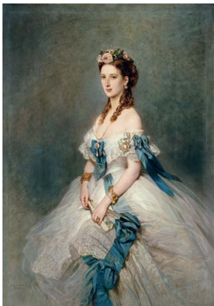
Franz Xaver Winterhalter Alexandra, princesse de Galles 1864